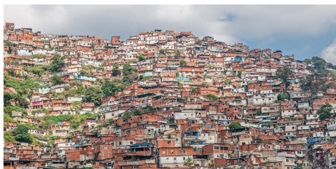
Barriadas en Caracas, Venezuela