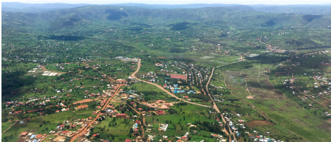
Vista aérea, Ruanda

La base de un sistema eficaz de tributación periódica de propiedades es un registro integral que incluya a todas las propiedades de una jurisdicción determinada, de modo que todas estén sujetas al sistema fiscal. Un registro completo de propiedades es esencial tanto para el potencial de la recaudación como para la justicia y la confianza de la población, dado que es improbable que los contribuyentes confíen en un sistema fiscal en el que ciertas propiedades estén sujetas al pago de impuestos y otras no. En la práctica, todos los sistemas fiscales de propiedades de países de bajo ingreso están plagados virtualmente de registros de la propiedad incompletos. Las presentaciones del segundo taller de la ATI y LoGRI destacaron los principales retos relacionados con los sistemas ineficaces de identificación de propiedades y las estrategias y los caminos para la reforma, con ejemplos de Senegal, Sierra Leona y Uganda.